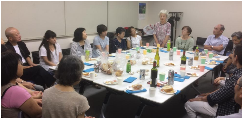
夏季特別プログラム懇親会 (2017.08.30) 雑司が谷地域文化創造館会議室 1Aにて