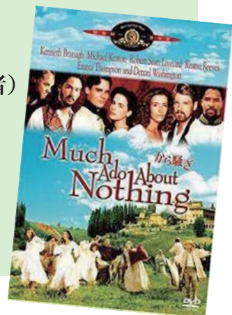
映画版の傑作、 ケネス・ブラナー監督・主演 (1993)